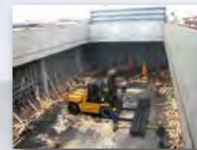
積み地/揚げ地 Loading/Unloading port

We are professional of processing of steel, please consult with us.