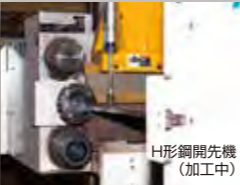
H形鋼開先機 (加工中)