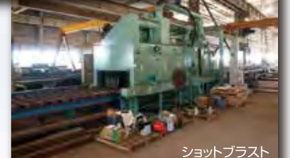
ショットブラスト